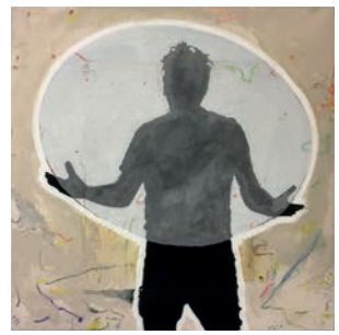
La vérité - The truth